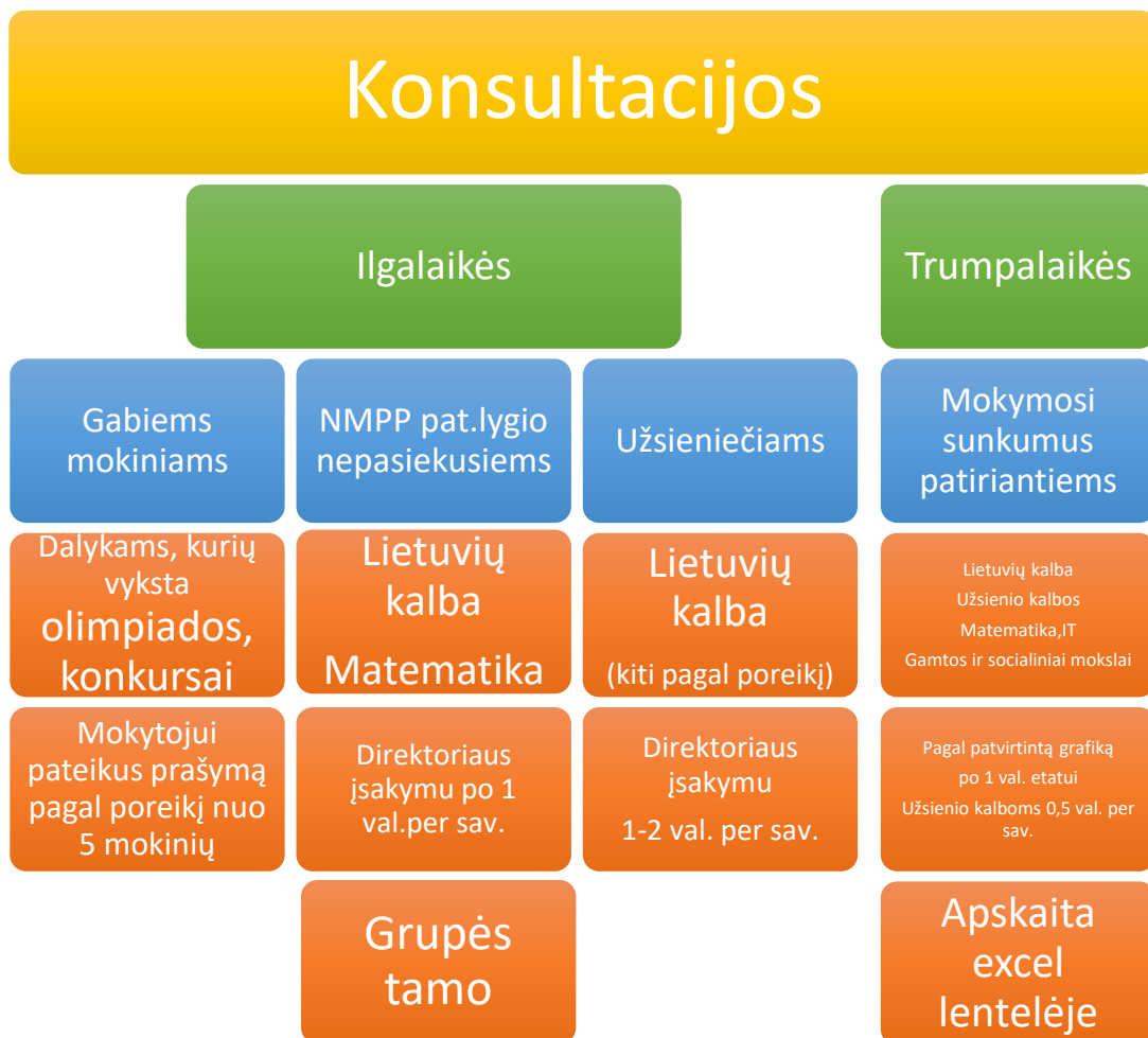
2 pav. Konsultacijų organizavimo schema.

37. Visa konsultacijų schema pateikiama 2 paveiksle.